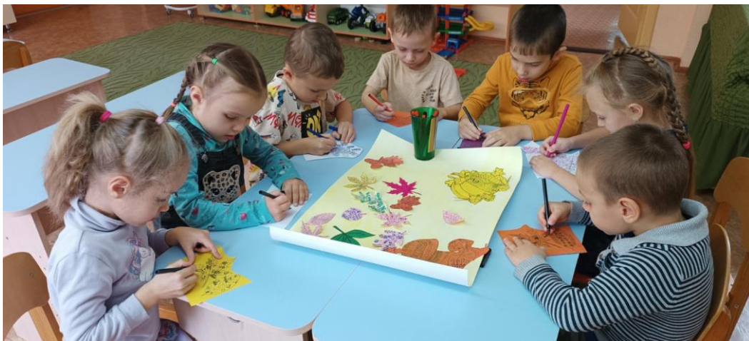
Выставка групповых коллажей «Сказки осенних листочков»